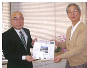
届けて頂いた埋橋所長

昨年 11 月に車椅子搬送車を贈呈した 伊那市の「伊那ゆいま〜る」の利用者から 『寄せ書き』を頂きました。(1/17)