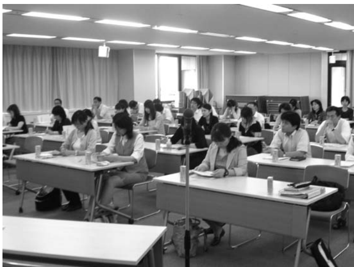
熱心に聞き入る参加者

労働組合としても、今後それぞれの単産で交渉、協約の見直しを行い、組合員にPRして、制度取得を推進していく事が大切です。参加者は構成組織より42名でした。(女性27名、男性15名)