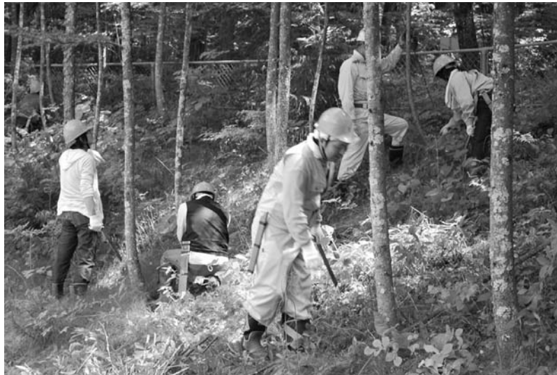
手のこを使って林業体験