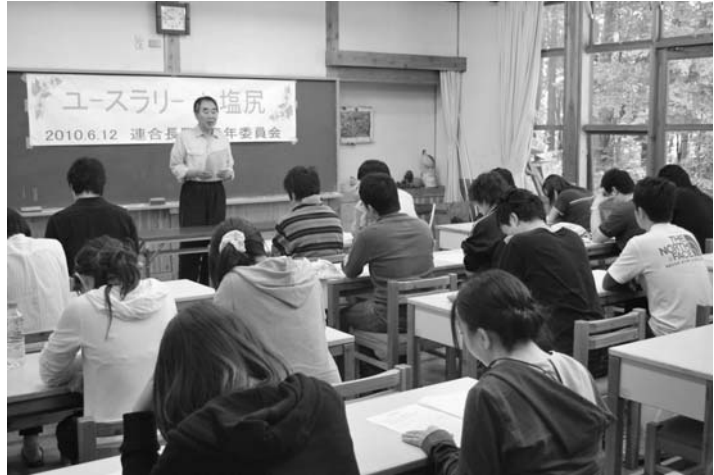
石上館長の講演に学習を深める参加者

当日は気温25度をこす暑い日でしたが、参加者は汗びっしょりになりながらも林業を身近に感じていました。