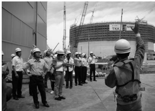
後方はLNGの巨大燃料タンク

【国交省】【経産省】【環境省】三省合同事業 住宅版エコポイント 始まっています!