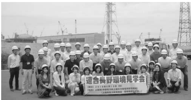
工事現場を背に記念写真(鉄塔は長野市まで届く送電線)

今回の環境見学会で、建設中の火力発電所を実際に目の当たりにして、頭では「環境だ」「エコだ」って解っているつもりでも、実際に新しいエネルギーを創造し、実用化することの難しさを痛感させられた。しかし、家庭や職場など身近なところから、出来ることからコツコツと積み上げて行くこと、実際に行動することの大切さを改めて認識させられ、有意義なものだった。