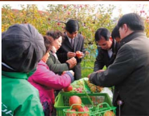
リンゴ農家でも交流

11月17日から3日間、趙忠才河北省総工会副主席を団長とする6名の第7次友好交流団が連合長野を訪問した。18日には連合長野との懇談会も開催されるとともに、昨年合意した「新協議書」を締結し新たな友好・交流のスタートとなった。