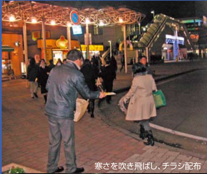
寒さを吹き飛ばし、チラシ配布

発行 日本労働組合総連合会 長野県連合会 発行人 中山千弘 〒380-8545 長野市県町532-3 労働会館3F TEL 026-234-1626 FAX 234-1349 E-mail info@rengo-nagano.jp http://www.rengo-nagano.jp/