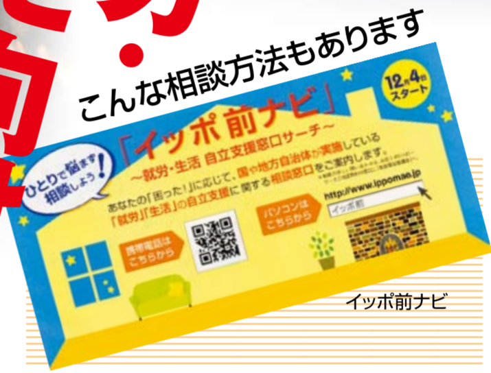
こんな相談方法もあります Ippononavi

12月7日、長野駅前で連合の「雇用と就労・自立支援に向けた全国とアクション行動」の取り組みとして、街頭行動を行なった。 厳しい雇用環境、経済状況の中で、雇用契約の更新拒否や打ち切りなど突然仕事を失う仲間が増えています。また、一時金の減額などで住宅ローンの支払いが滞る等、生活不安も広がっています。連合長野は、全国統一アクション行動以外にも12月23～27日まで「長野・松本・小諸・飯田」の4箇所、「年の瀬 雇用・生活相談会」を開催し、雇用問題や生活支援の相談体制を確立してきました。