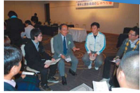
熱く語る津田弥太郎参議院議員