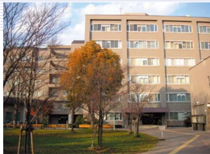
信大経済学部キャンパス