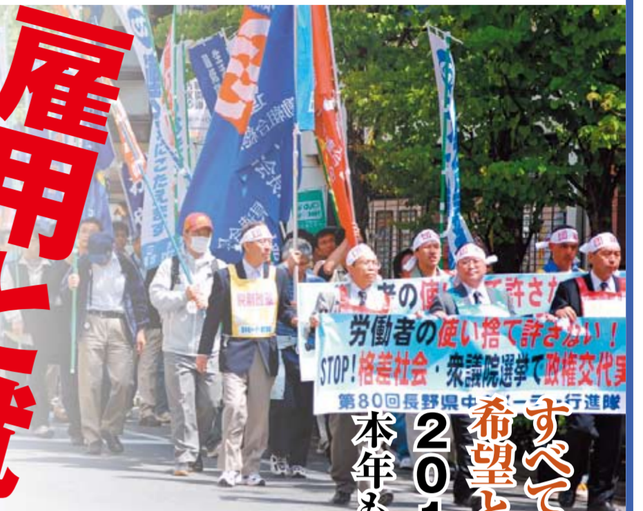
第80回メーデーのデモ行進

2010年 希望と安心の社会を築こう すべての働く者の連帯で 本年もよろしくお願ひします。 連合長野執行委員会