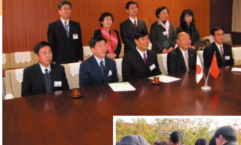
県庁訪問の代表団