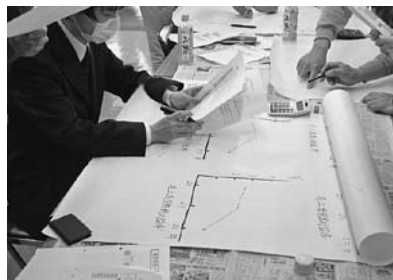
発表資料を作成するグループ

出来上がった分析のプレゼンはとても素晴らしいものとなった。受講者の中からは、貸借対照表と損益計算書だけでは明らかにならない、キャ