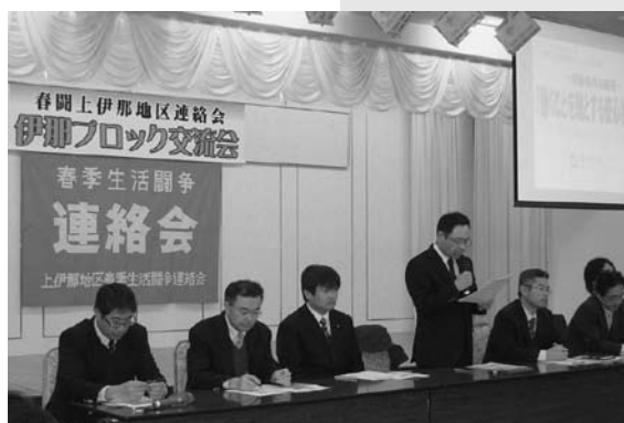
2/21 上伊那地区伊那ブロック集会