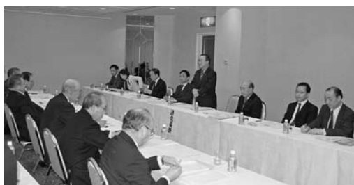
長野県中小企業団体中央会申し入れ

2011春季生活闘争の経営者側への申し入れおよび労使懇談は、以降、2月10日に長野県中小企業団体中央会、2月14日に長野県商工会連合会・長野県商工会議所連合会で実施しました。