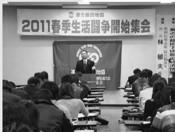
2/8 飯田地協闘争開始宣言集会