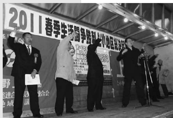
3/1 上小地区総決起集会