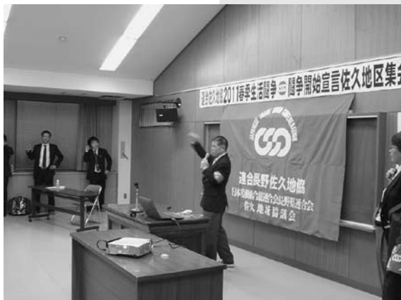
2/7 佐久地協闘争開始宣言集会