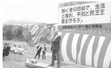
メーデー須高地区大会5/1-1300名