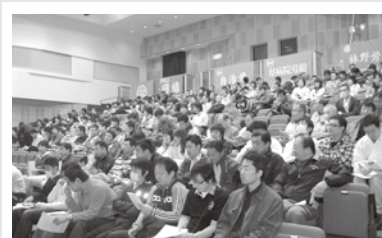
木曾地区メーデー5/1-260名