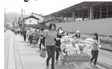
北信地区メーデー5/1-1248名