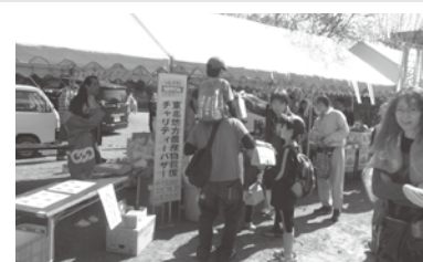
飯伊地区メーデー4/29-1700名