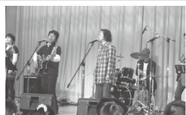
大北地区中央メーデー4/29-100名