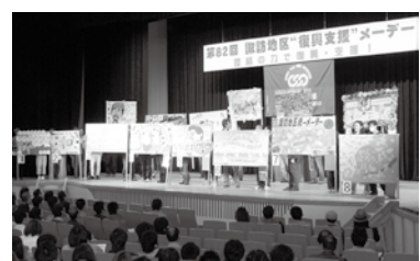
諏訪地区統一メーデー4/29-1200名