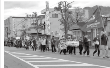
上小地区メーデー5/1-1986名