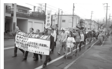
上伊那地区メーデー5/1-1300名