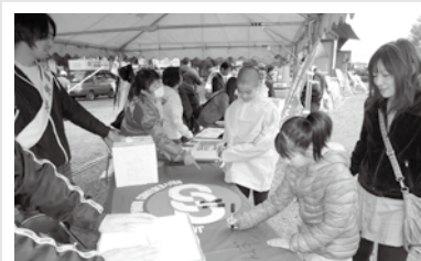
松本地区メーデー5/1-2300名