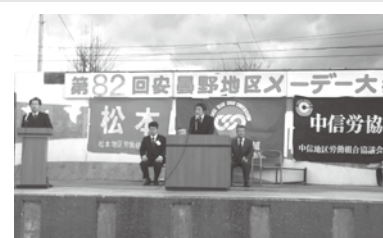
安曇野地区メーデー5/1-308名