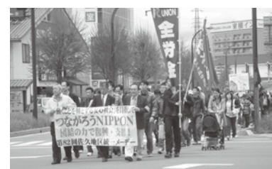
佐久地区統一メーデー5/1-1200名