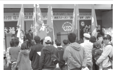
塩尻地区統一メーデー4/29-650名