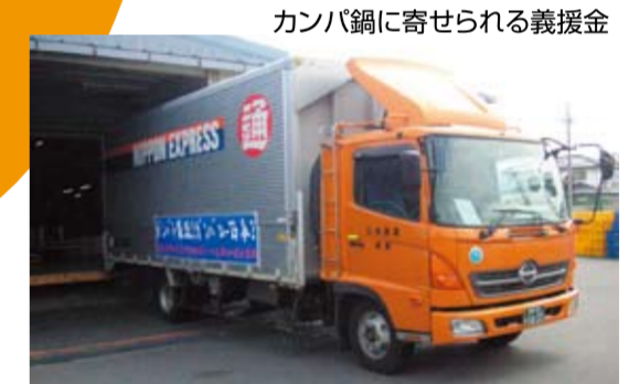
3/22 支援物資(連合長野)を運ぶトラック

■3月18日「大規模地震の被災者の方々を支援する県民共同宣言」 ■3月19日(土)長野市内3箇所で開催された義援金活動130,391円のご協力がありました。