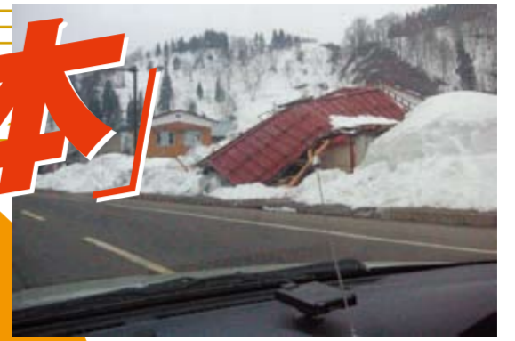
15日の栄村現地 倒壊した屋根