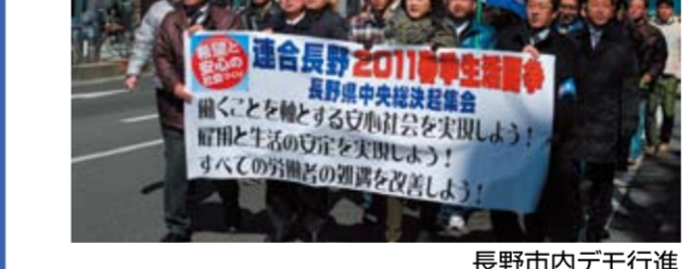
長野市内デモ行進

—2011春闘勝利に向けて、県中央集会を開催— 3月5日(土)長野市「南千歳公園」で、2011春季生活闘争勝利県中央総決起集会が開催された。近藤会長から「配分の歪みを正し、生活と賃金の復元を目指すとともに、全ての労働者の処遇改善を求めよう」と挨拶がありました。