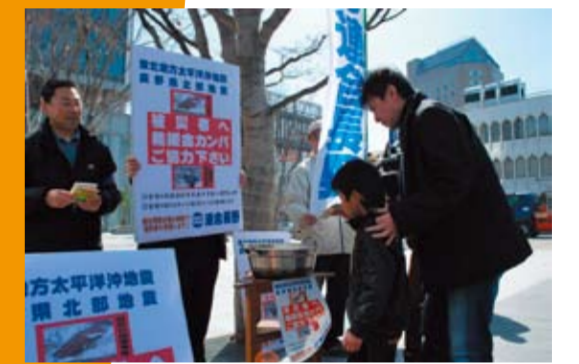
カンパ鍋に寄せられる義援金