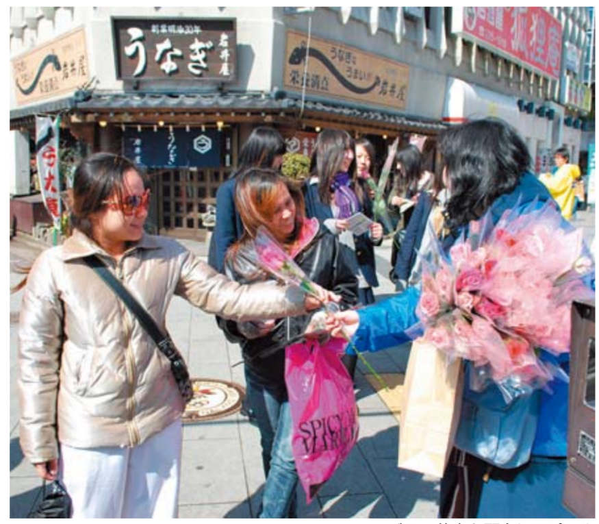
バラの花束を配布しアピール