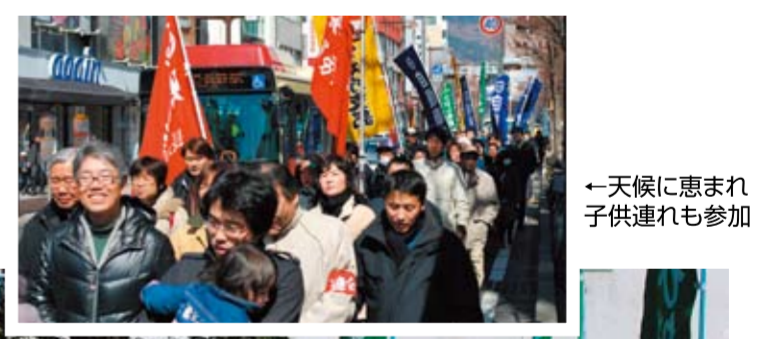
←天候に恵まれ子供連れも参加