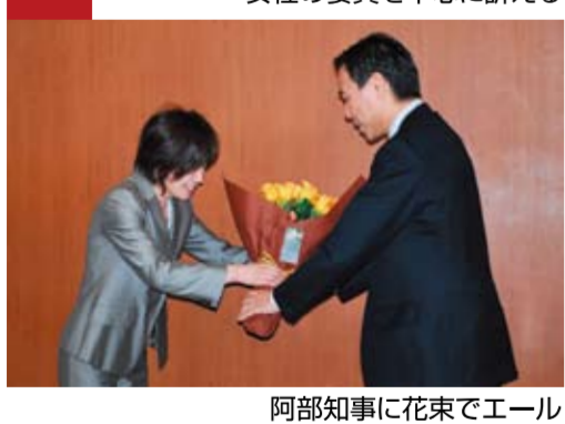
阿部知事に花束でエール

3月5日(土)国際女性デー(3/8)の行動の一環として、長野駅前「均等待遇の実現」などを訴えるとともに、バラの花を配布し社会や職場での「男女平等参画社会」への行動参加を呼びかけました。 また、3月8日には男女平等参画推進専門委員のメンバーが阿部知事と懇談し、長野県政への要請も行ないました。