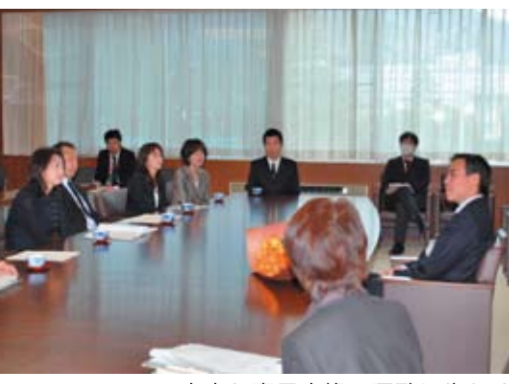
率直な意見交換で県政に生かす