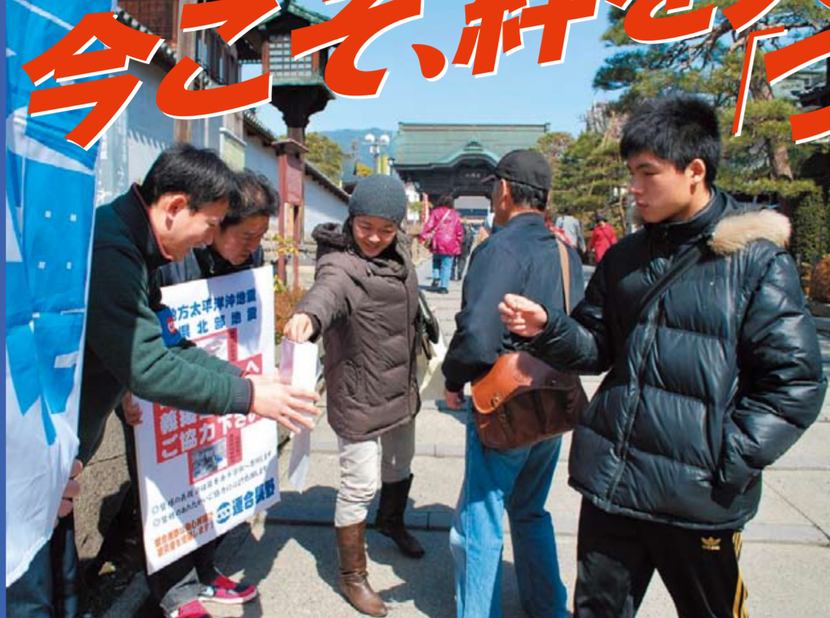
3/19 善光寺でも温かい支援

3月11日午後2時46分に発生したM.9.0の「東北地方太平洋沖地震」では、地震・大津波・原発事故と未曾有の複合災害となり、今なお、被害の全容が把握できない広範囲の大災害となりました。