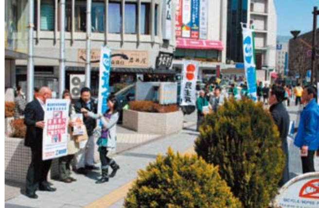
3/19 長野駅前での呼びかけ