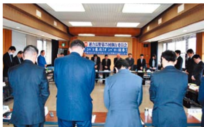
3/23 執行委員会で黙祷・支援対応を確認