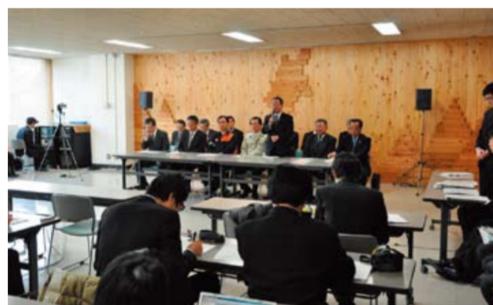
県や経済団体と共同会見で決意を述べる