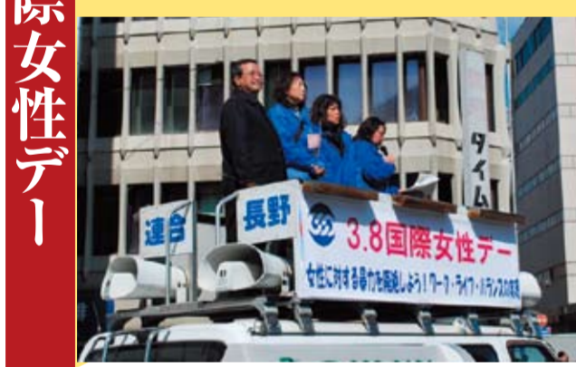
女性の委員を中心に訴える

3月5日(土)国際女性デー(3/8)の行動の一環として、長野駅前「均等待遇の実現」などを訴えるとともに、バラの花を配布し社会や職場での「男女平等参画社会」への行動参加を呼びかけました。 また、3月8日には男女平等参画推進専門委員のメンバーが阿部知事と懇談し、長野県政への要請も行ないました。