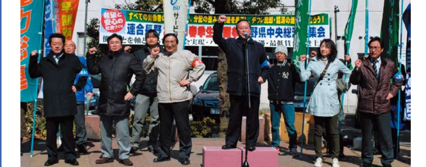
春闘勝利へ団結ガンパロウ

第82回長野県中央メーデー ■開催日時/2011年5月1日(日) 9時30分開会 ■開催場所/長野市城山公園「ふれあい広場」 メインスローガン 「働く者の連帯で、ゆとり・豊かさ・公正な社会を実現し、自由で平和な世界をつくろう」 特別スローガン 「団結の力で復興・支援!!」