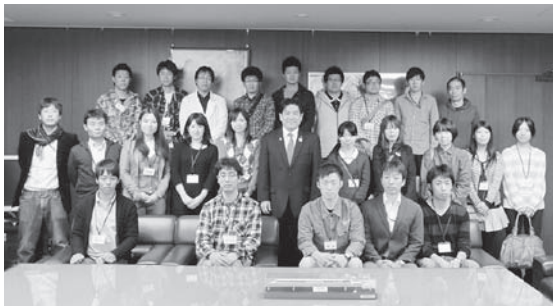
羽田雄一郎参議院議員と大臣室にて

1日目は参議院議員会館到着後、国会議事堂(参議院)を見学。午後は参議院議員会館の地下会議室にて連合本部政治センター阿部高士局長による「労働組合と政治との関わり」についての講演をお