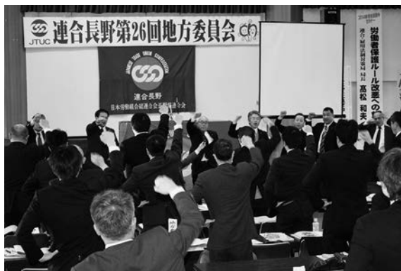
要求実現のため団結ガンバロー!

連合長野は1月17日(金)、長野県松本勤労者福祉センターにおいて、2014春季生活闘争方針を決定する「第26回地方委員会」を開催した。執行部、地方委員、女性・地協特別地方委員、傍聴など約100名出席のもと、経過報告、春季生活闘争方針などの議案を採択した。