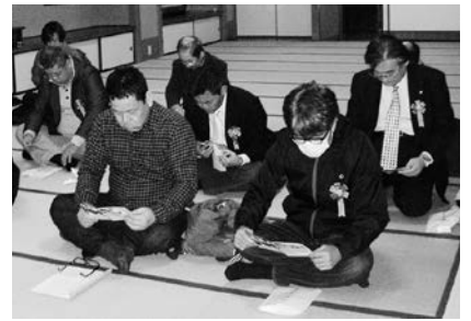
活動家学校参加者が永平寺で法話を聞く