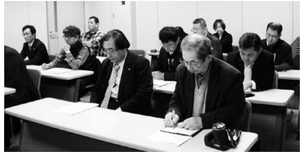
石川県部落解放同盟北陸事務所での研修風景

日々の忙しい限られた時間の中で非常に難しい事ではあるが常に頭の隅において行動したいものである。研修に参加された皆様大変ご苦労さまでした。