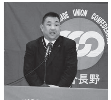
あいさつする師玉組織拡大委員長