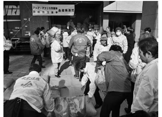
協力してトラックへの積み込み