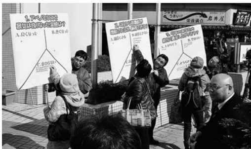
市民の協力を得た街頭アンケート