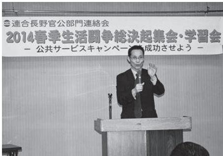
花村公務労協副事務局長の熱の入った説明

り組んできた『長野県の契約に関する条例』(以下、公契約条例)について、3月11日、長野県議会危機管理建設委員会で可決。14日の本会議においても全会一