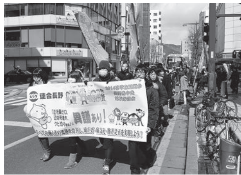
シュプレヒコールをしながらのデモ行進