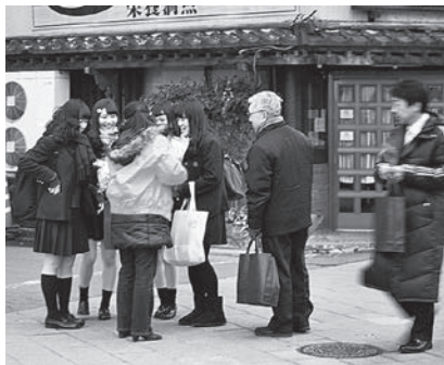
バラの花を配布し、国際女性デーをアピール

一人ひとりの行動で男女平等参画が普通の姿となる安心社会の実現を目指していこう!!