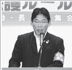
連合松本・大久保議長による 決意表明