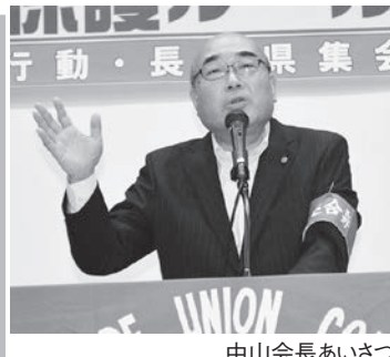
中山会長あいさつ