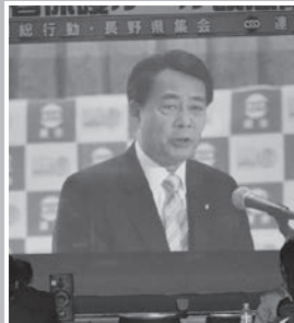
民主党・海江田代表