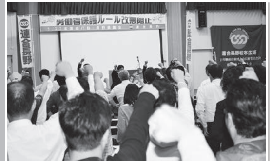
団結してガンパロー!