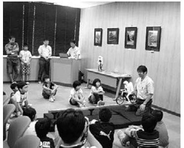
「ムラタセイサク君」のデモ

午前中、村田製作所の半導体モジュール技術のシンボルキャラクター「ムラタセイサク君」の展示と工場見学をおこない、工場内の食堂で親子一緒に昼食をとりました。