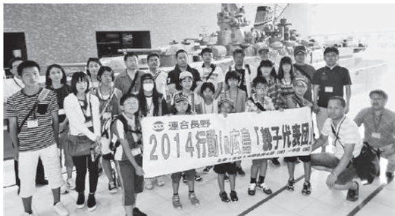
広島「親子代表団」の皆さん

たった一発で様々なものを奪うことが出来る原爆が、まだ世界中にはたくさんあるということもすごく恐ろしいことだし、広島のを忘れない、他人事ではいけないと強く思いました。参加することができ良い経験が出来ました、ありがとうございました。