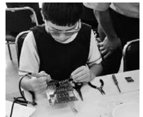
保護メガネ越しにはんだ付け

小諸村田製作所労組役員の手助けもあって、すべての子供たちが、時間内に作業を終えることができました。子供たちの製作したすべてのライトレースカーを、フリーハンドで書かれたライン上で試走させ、正常に動作することを確認して終了しました。