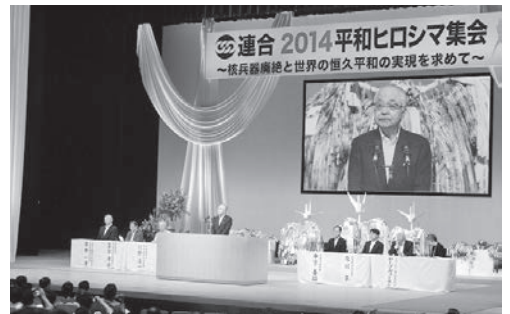
連合2014平和ヒロシマ集会の様子