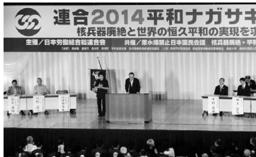
連合2014平和ナガサキ集会の様子

被爆者の生の声を聞ける最後の世代である我々が、核兵器・戦争が如何に悲惨かを後生に伝えていかなければならない。