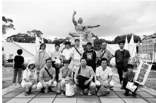
長崎代表団の皆さん