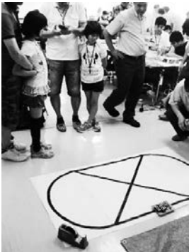
完成検査は試走で確認

午後は、組合会館に移動して、会議室でライトレースカー（自走式キャリアの模型）づくりの指導を受けました。作業前に子供たちに対し、前掛けの着用や防護メガネの装着など、安全の保持について徹底しました。