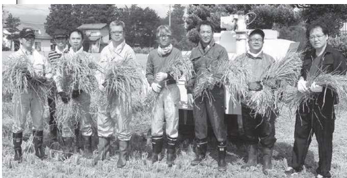
安曇野協力田(9月20日)