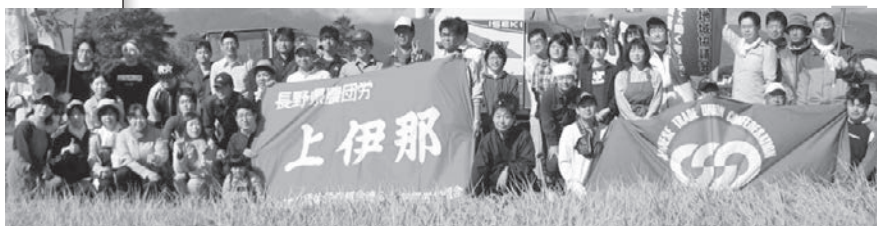
上伊那協力田(9月27日)