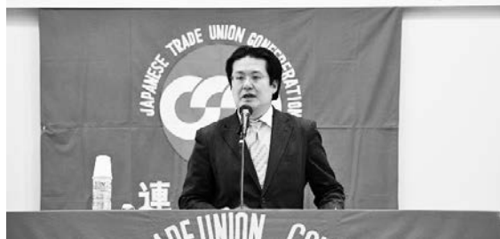
講演する連合本部曾原労働条件中小労働局長

て60年の節目の年。我々労働組合が行なう春闘を通じた賃上げの成果は、社会全体の賃金相場を形成する取組となる。波及する、波及させる事を意識し社会的責任を果たす場である。賃金決定は、経済レベルでも、企業レベルにおいても『付加価値分』であり、これまでの偏った配分の歪みを是正する機会となる。金融緩和だけではデフレ脱却は困難であり、『産業構造の変化を踏まえた賃金労働条件の向上が不可欠』だ。労働組合が自らの力で経済の好循環を作り出し、賃上げを確実に勝ち取り、将来に希望が持てる社会への一歩を切り開く2015春闘にしていこう」と元気が出る春闘とすべく期待を込めた講演をいただいた。