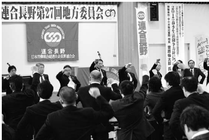
要求実現のため団結ガンバロー!

「賃上げ」「時短」「政策制度実現」 「経営対策活動」の4本柱に 全力を挙げて取り組む