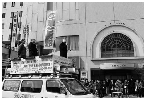
長野駅前でのリレーアピール・街宣行動