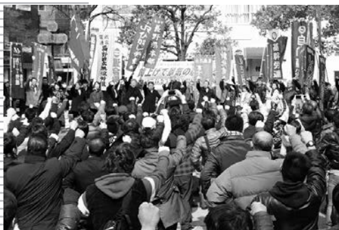
春闘勝利に向け全員で「団結ガンパロー三唱」

での働く者の処遇改善、底上げ・底支え、格差是正に取り組むことを訴えるとともに、集会参加者とともにビラを配布しながら市民にアピールした。