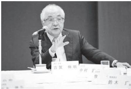
熱心に意見交換する古賀会長