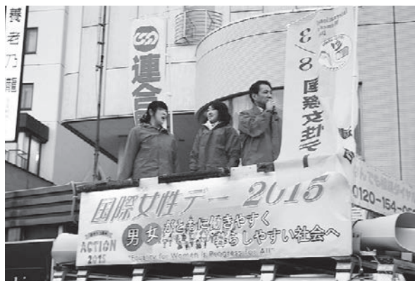
メンバーによるリレーアピール

昨年委員会では、第4次男女平等参画推進計画の策定に向けWGを設置し、第3次計画の進捗状況の点検活動として、構成組織へのアンケート調査をした上で、構成組織を訪問し役員の方々との懇談を実施した。その中では、これまで表には出てこなかった耳を疑うような男女差別の事象や、職場では口にできなかった悩みなどを当事者の方より直接伺うことができ、声なき声を聴き現実をしかと受け止めた。