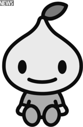
全労済公式キャラクター 「ビットくん」