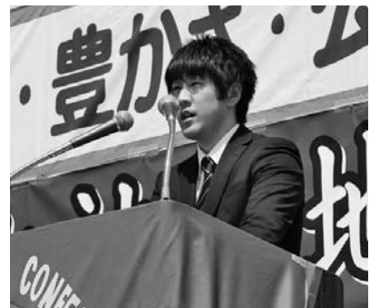
大学生より労働運動に期待するメッセージ