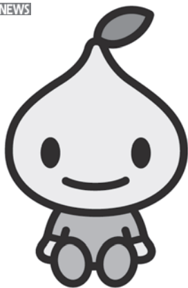
全労済公式キャラクター 「ビットくん」