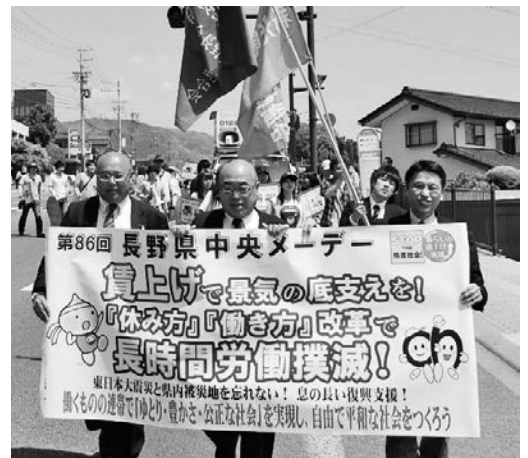
デモ行進する参加者

コースを変更したデモ行進では、各組織が「平和を守り、雇用を立て直す。みんなの安心のため、さらなる一步を踏み出そう!」とアピールするなど、働く者の元気を発信しました。