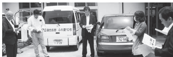
伊那ゆいま〜るで有賀施設長より説明を受ける