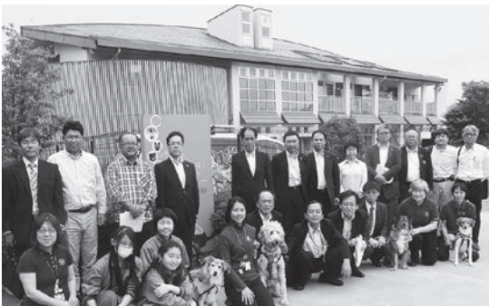
職場体験の中学生も一緒に記念写真