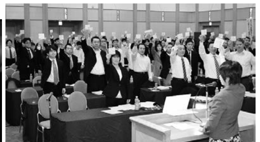
連合長野第27回定期大会 ディーセント・ワーク2015アクション