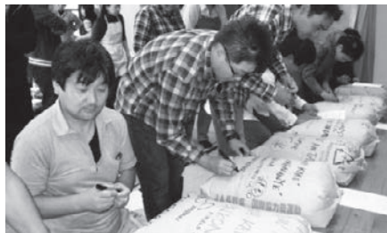
上伊那協力田(10月3日)