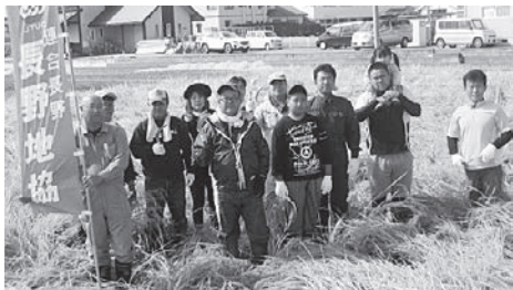
安曇野協力田(9月22日)