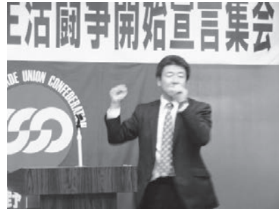
荻原議長による団結ガンパロー