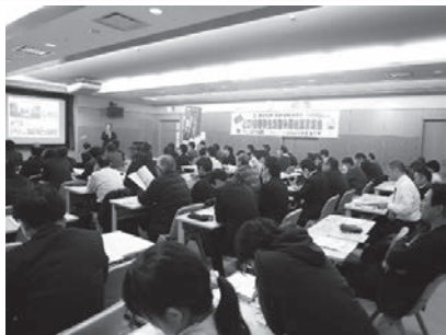
根橋事務局長による研修会