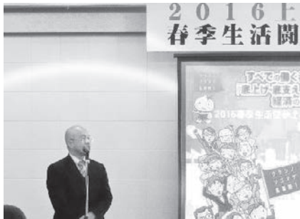
下村議長による挨拶