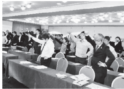
会場全体での力強い団結ガンパロー