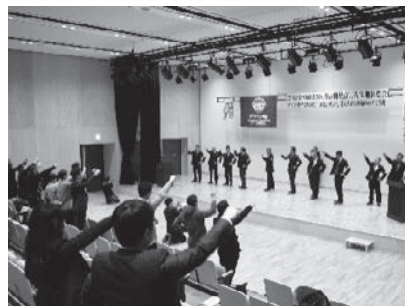
依田議長による団結ガンパロー