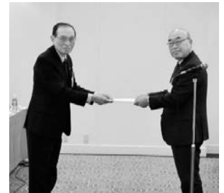
中小企業団体中央会 春日会長に申し入れ書を手交する中山会長(右)