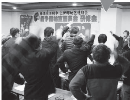
勝利に向けた 団結ガンバロー