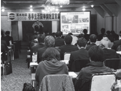
根橋事務局長による研修会