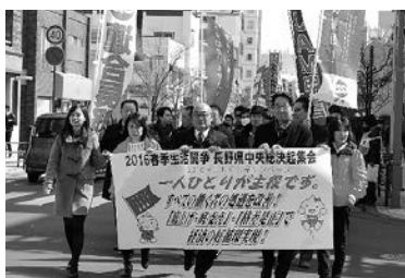
シュプレヒコールしながらのデモ行進

2016春季生活闘争は、組織労働者の賃上げの成果を全ての働く者に波及させ、社会全体の底上げ・底支えを実現する闘いである。連合長野は全構成組織・地域協議会とともに、すべての働く者の処遇を「底上げ・底支え」するため、「クラシソコアゲ応援団!」を運動の両輪として、今こそ果たすべき労使の社会的責任について広く訴えていく。