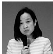
長野県副知事 中島 恵理氏