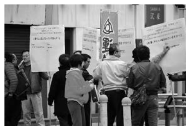
市民の皆さんにご協力いただいた街頭アンケート