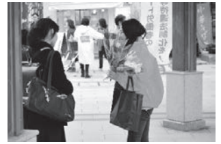
長野駅前ではバラの花とティッシュを配付しアピール

連合長野は、引き続き、第4次男女平等参画推進計画に基づき、5月19、20日の「女性のための労働相談ダイヤル」、6月の「男女平等月間」・「女性リーダー育成講座」の開催など、男女が対等・平等な社会の実現をめざし取り組んでいく。