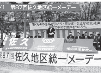
佐久市:ミレニアムパーク 700名