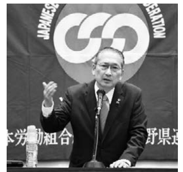
ご講演いただいた神津会長