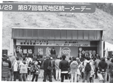
塩尻市:チロルの森臨時駐車場 300名