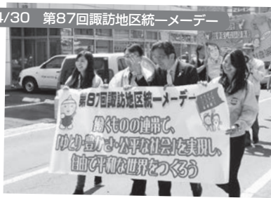
諏訪市:諏訪市文化センター 1,000名