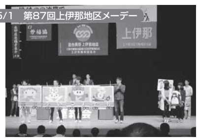
伊那市:県伊那文化会館 1,200名