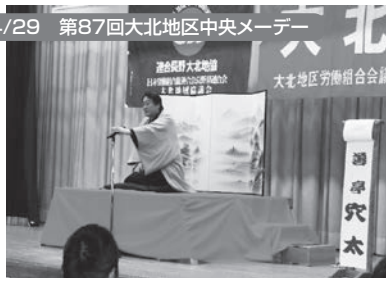
大町市:サンアルプス大町 169名