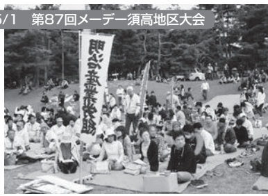
須坂市:百々川緑地公園 900名