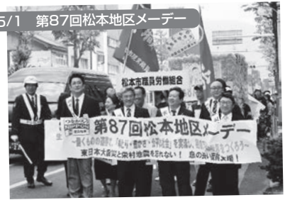
松本市:あがたの森公園(芝生広場) 1,200名