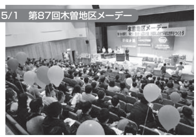
上松町:ひのきの里総合文化センター 350名