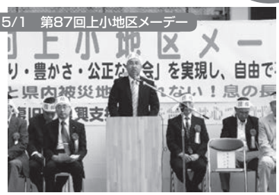
上田市:城跡公園陸上競技場 1,654名