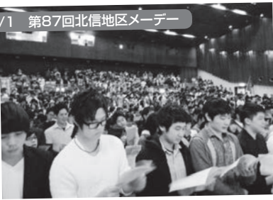
中野市:中野市民会館 829名