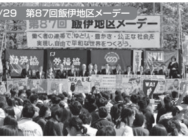
飯田市:飯田風越公園 1,500名