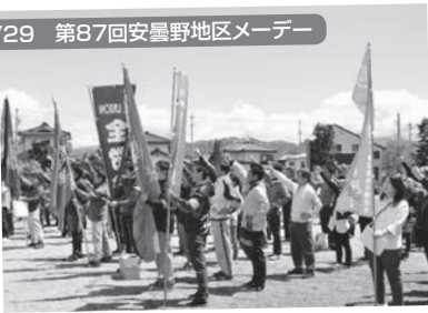
安曇野市:豊科中央公園 281名