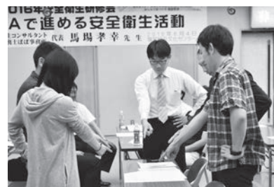
グループにわかれ危険予知訓練を行った

連合長野は、定期的な労使協議を通じて、すべての職場において安全衛生委員会の設置を求めている。引き続き、研修会の実施、労働行政・経済団体への要請行動を通じて、県内の中小企業労組に向けた支援を展開していく。