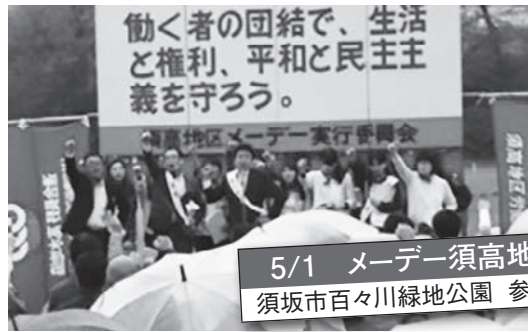
5/1 メーデー須高地区大会 須坂市百々川緑地公園 参加者850名