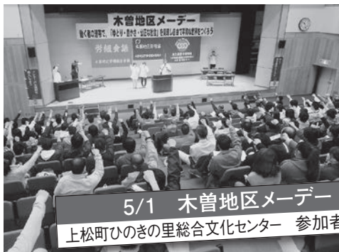
5/1 木曾地区メーデー 上松町ひのきの里総合文化センター 参加者280名