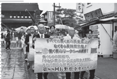
雨のなか元気に行進する参加者