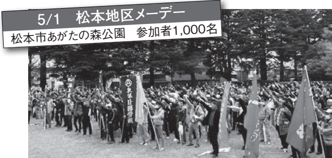
5/1 松本地区メーデー 松本市あがたの森公園 参加者1,000名