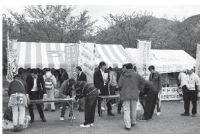
労福協連携・協働ブース