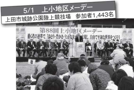
5/1 上小地区メーデー 上田市城跡公園陸上競技場 参加者1,443名