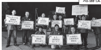
佐久地協 5月17日 佐久駅前 地協役員の皆さん11名にて街頭アピール