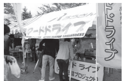
フードライブコーナー