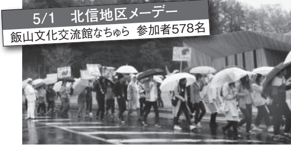
5/1 北信地区メーデー 飯山文化交流館なちゅら 参加者578名

4月29日(土) から5月1日(木) にかけて県下各地区でもメーデーを開催し約13,000人が集結した。各地域とも特色あるメーデーが開催され、ご家族も含め大勢参加。これからも県内で働くすべての労働者のクラシノソコアゲをめざして、地域から元気を発信していこう！