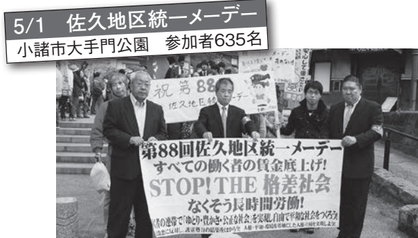
5/1 佐久地区統一メーデー 小諸市大手門公園 参加者635名