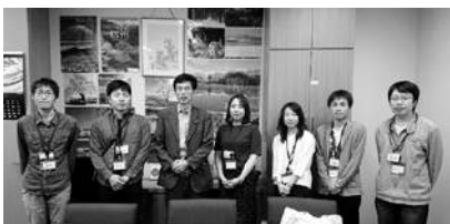
篠原事務所に篠原議員と

議員、杉尾秀哉参議院議員4名の事務所訪問と国会議事堂の見学、羽田雄一郎参議院議員との意見交換を行った。