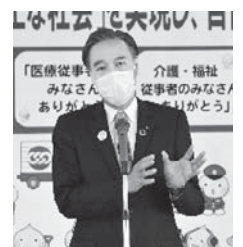
ご挨拶をいただく阿部知事

最後に岩崎事務局次長からメーデー宣言が読み上げられ、新型コロナウイルスの影響を受けた異例のメーデーは幕を閉じた。