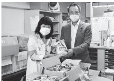
フードバンク信州美谷島事務局長(左) 連合長野根橋会長(右)

これを受け、連合長野は、7月1日より家庭・職場でできる新型コロナウイルス対策支援として、「助け合い・支え合い フードドライブ」を開始した。新型コロナウイルスの影響により、収入が減少したり職を失ってしまうなど、生活に困窮する方が増加している。助け合いの輪を上げ、食料を必要としている方を継続的に支援していくため、多くの皆さんからのご協力をお願いしたい。