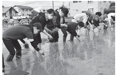
長野協力田は、6月20日(土)、長野地協により田植えを実施した